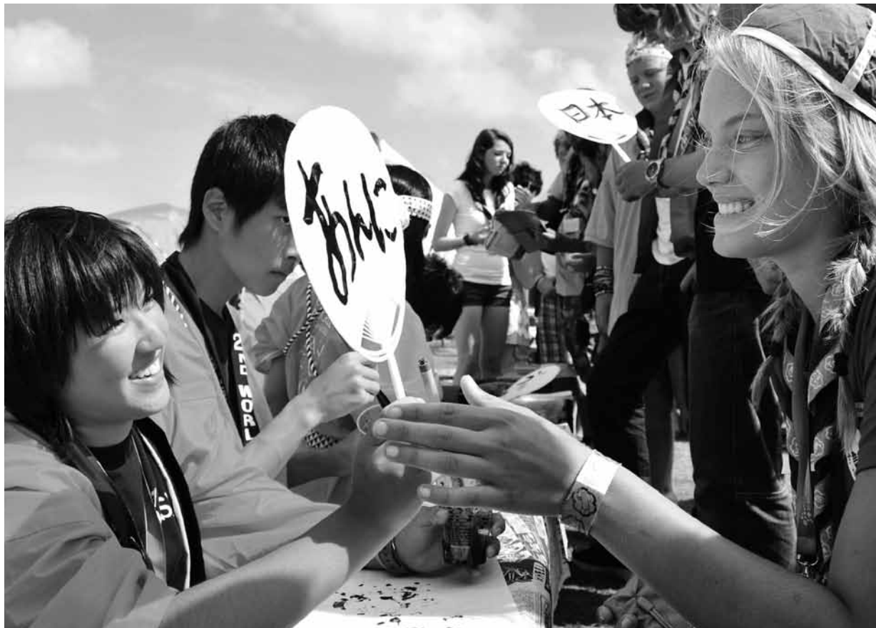
第22回世界スカウトジャンボリー（スウェーデン）より