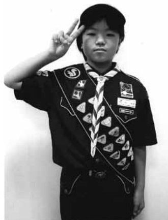
チャレンジ章をたくさん取得したカブスカウト

ビーバースカウト、カブスカウト、ボーイスカウト、そしてベンチャースカウト。それぞれの部門でその年代のスカウトにふさわしい様々なプログラムが用意されています。そしてその達成度を示すのが、数多くのバッジです。