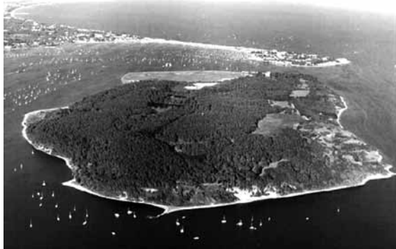
ブラウンシー島（イギリス・ドーセット州）1907年8月1日～9日、20人の少年とベーデン-パウエルによる実験キャンプが行われた。

結果は大成功でした。少年たちは仲間を作り協力しながら、野外でのいろいろな活動やゲームを行い、キャンプ生活を存分に楽しみました。